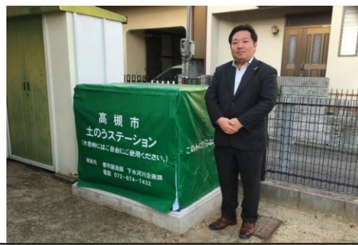
3月議会 本会議質疑しました